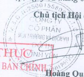
Đặng Việt Thăng